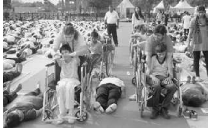
পদক্ষেপ খুবেই প্ৰশংসনীয়। কিন্তু কাৰ্যক্ষেত্ৰত কিমান দূৰ সফল হয় সেয়াহে অনাগত সময়ত লক্ষণীয় হ’ব।

অনুষ্ঠানত উপস্থিত থাকি মুখ্যমন্ত্ৰী সৰ্বানন্দ সোণোৱালে কয় যে, আমাৰ লক্ষ্য ৰাজ্যৰ ভিন্ন প্ৰান্তত থকা দিব্যাংগসকলক চিনাক্ত কৰা। সকলোকে সামাজিক নিৰাপত্তা প্ৰদান কৰা হ’ব। বৈধ নাগৰিকৰ বাবে শংকাৰ কাৰণ নাই। এই আঁচনিৰ বাবে চৰকাৰে ধাৰ্য কৰিছে মুঠ ২৫০ কোটি টকা। প্ৰথম পৰ্যায়ত এক লাখ দিব্যাংগক প্ৰদান কৰা হ’ব এই সাহায্য। সি যি কি নহওঁক, মুখ্যমন্ত্ৰী সোণোৱাল নেতৃত্বাধীন চৰকাৰখনে গ্ৰহণ কৰা