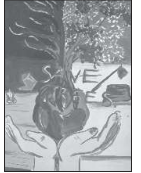
প্ৰণিতা তালুকদাৰ সপ্তম শ্ৰেণী