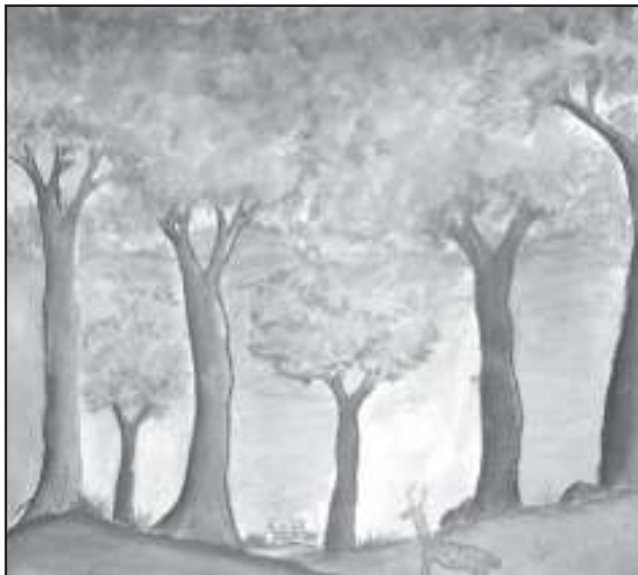
মানসজ্যোতি ভৰালী ষষ্ঠ শ্ৰেণী