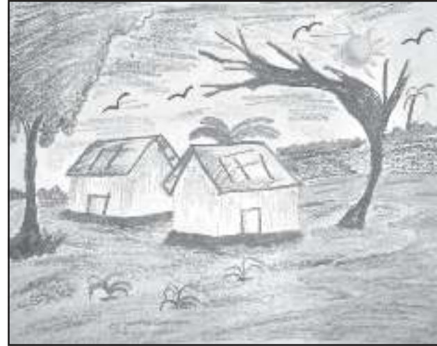
শান্তনু দাস চতুৰ্থ শ্ৰেণী