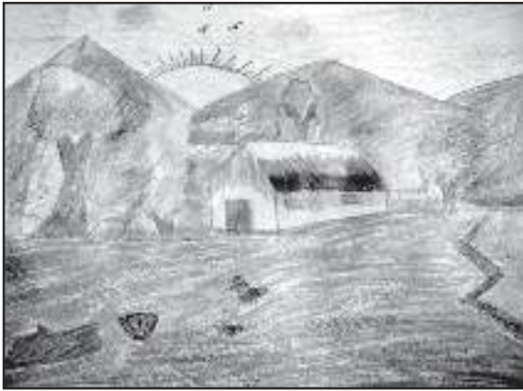
আনছাদ আলী তৃতীয় শ্ৰেণী