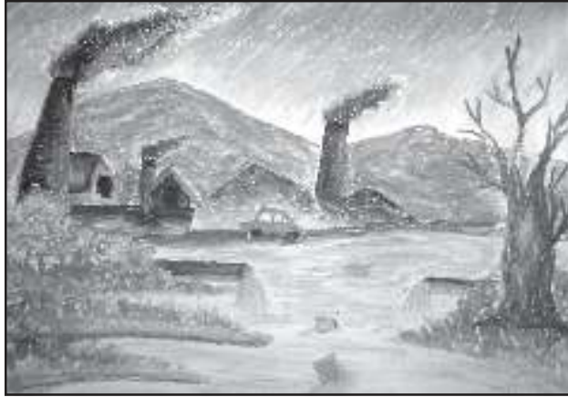
অৰ্পিতা ভট্টাচাৰ্য ষষ্ঠ শ্ৰেণী