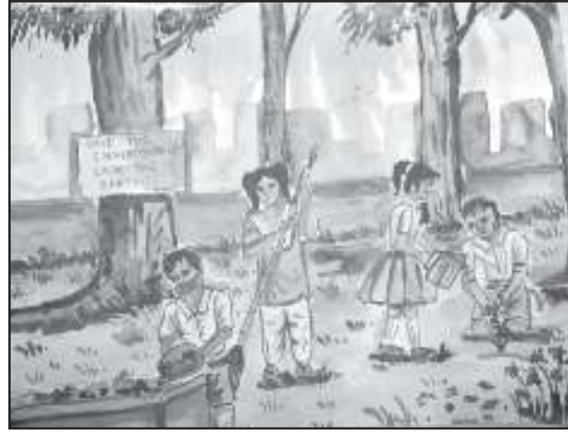
ফাৰ্দিনা চাহেল অষ্টম শ্ৰেণী