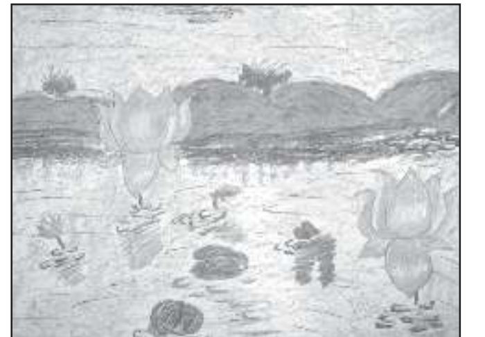
সাব্যাসাচী ঘোষ দ্বিতীয় শ্ৰেণী